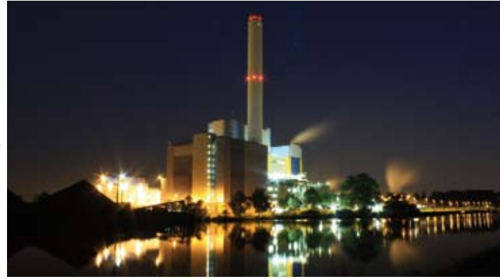
El uso de la fracción orgánica

La fracción orgánica puede ser utilizada para el procesamiento de compostaje.